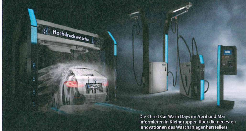
Die Christ Car Wash Days im April und Mai informieren in Kleingruppen über die neuesten Innovationen des Waschanlagenherstellers

Der Erfolg der Christ CAR WASH DAYS 2020 im Herbst vergangenen Jahres war so groß, dass sich der süddeutsche Waschanlagenhersteller entschlossen hat, dieses Veranstaltungsformat auch 2021 seinen Kunden anzubieten. Diesmal zeigt Christ seine komplett neu entwickelte Produktfamilie in veritabler „Christ-DNA“ in den Monaten April und Mai.